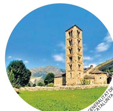
GENERALITAT DE CATALUNYA

En el marc de l'Any Josep Puig i Cadafalch, el Centre Excursionista de Catalunya proposa una excursió per la Vall de Boí seguint les traces de l'arquitecte en l'expedició historicoarqueològica de l'Institut d'Estudis Catalans a la Vall d'Aran i a la Ribagorça l'any 1907.